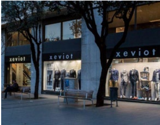
Xeviot Sabadell, Passeig Manresa no 32, 08202 Sabadell