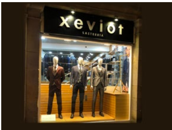
Xeviot Barcelona, C/ Conde Salvatierra no 10, Barcelona 08006