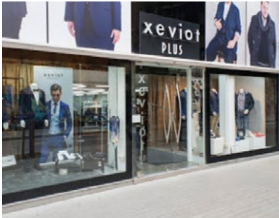
Xeviot Plus, C/ Salut 4 08202 Sabadell (a 20 metros de Xeviot Sabadell)